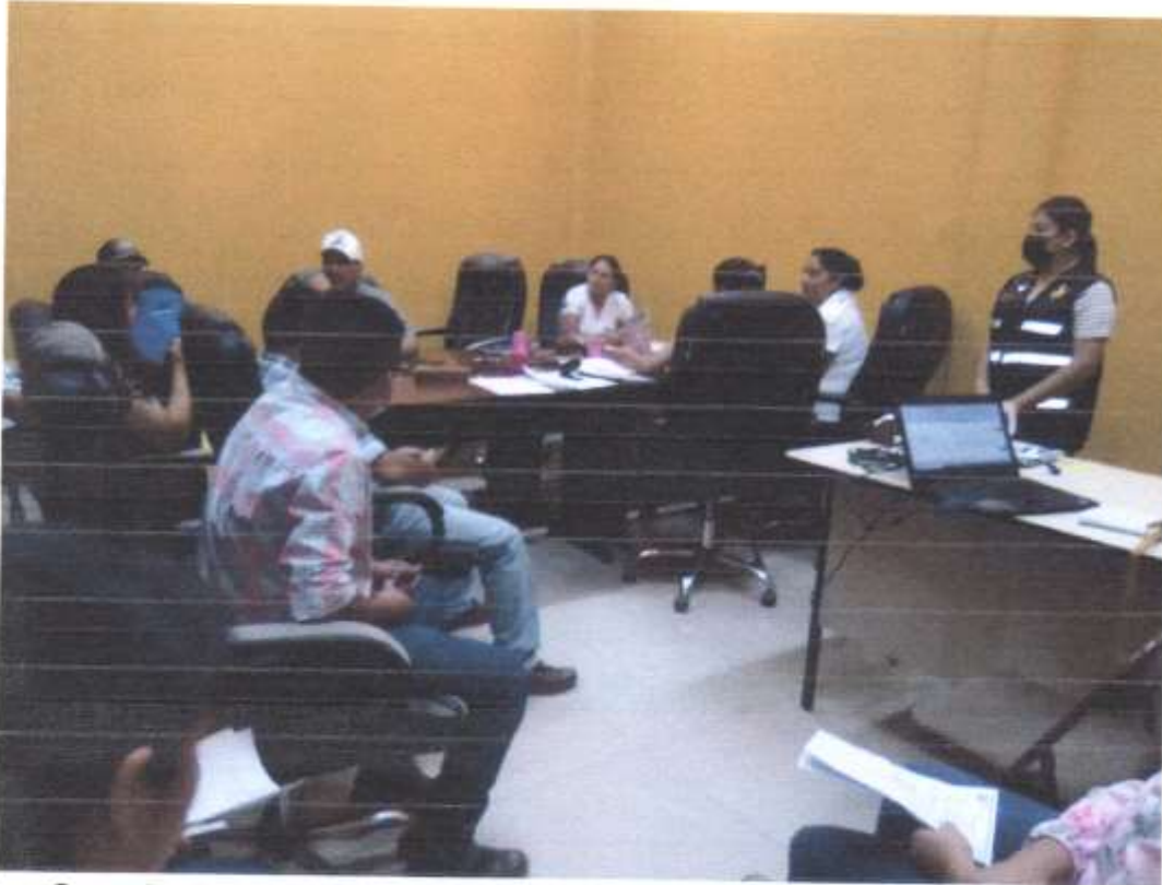
Capacitación sobre elaboración de POA.

Reunión de corporación para dar a conocer el POA.