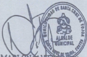
LIC. MARLON JAVIER MEDINA ALCALDE MUNICIPAL

partes contratantes que lo NO previsto en este contrato se regirá por la leyes aplicables y ambas partes se someten a mesas de resolución de disputas con el propósito de que las mismas puedan ayudar a las partes a resolver los desacuerdos y desavenencias y posteriormente pueda recurrir a un arreglo conciliatorio o arbitral o en su defecto a la jurisdicción de lo contencioso administrativo todo previo agotar la vía administrativa según lo establece el artículo 3-A y artículo 129 del Decreto N° 266-2013, contentivo de la Ley Para el Fortalecimiento Transparencia en el Gobierno. DÉCIMO SÉPTIMO: RATIFICACIÓN. - Ambas partes contratantes están de acuerdo con el contenido de cada una de las clausulas anteriores en todas sus partes en fe de lo cual y manifestando el CONTRATISTA que es cierto todo lo aquí expuesto por la MUNICIPALIDAD , firman el presente contrato en la ciudad de Santa Cruz De Yojoa, Departamento de Cortés, a los veinte (20) días del mes de Diciembre del 2021.