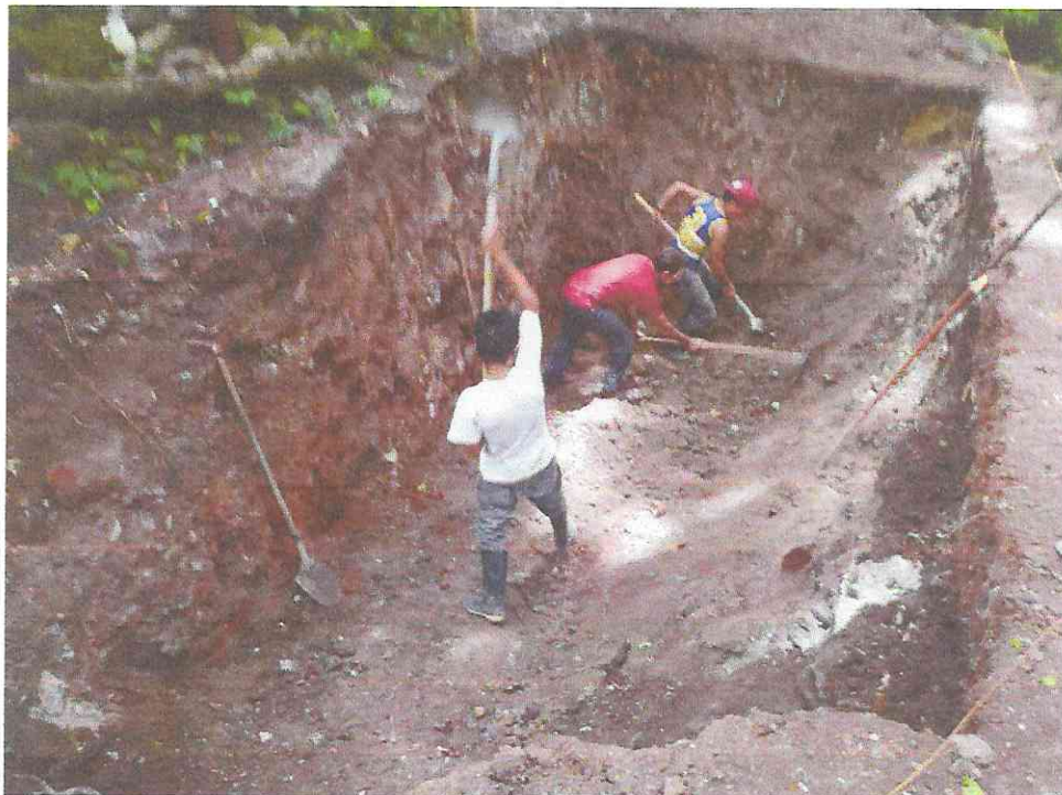
Excavación para la construcción de la Cisterna (5.40m x 2.80m x 2.40m de profundidad)