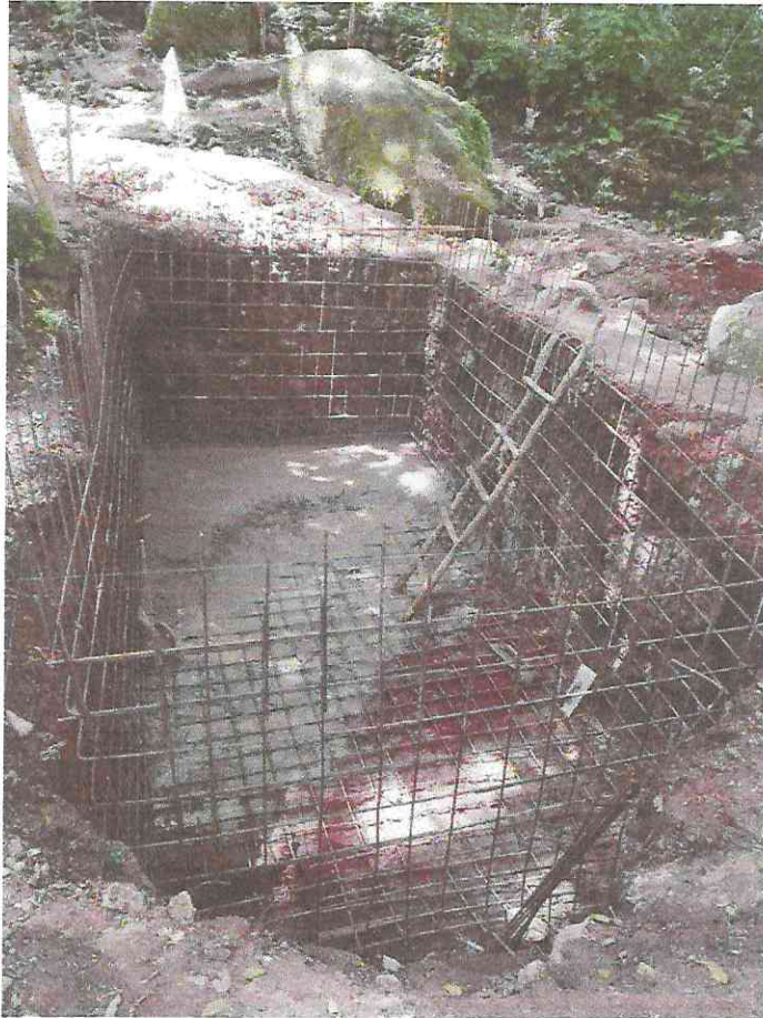
Fundición de Base de Cisterna con concreto y armado con Acero de 3/8" de paredes de la cisterna