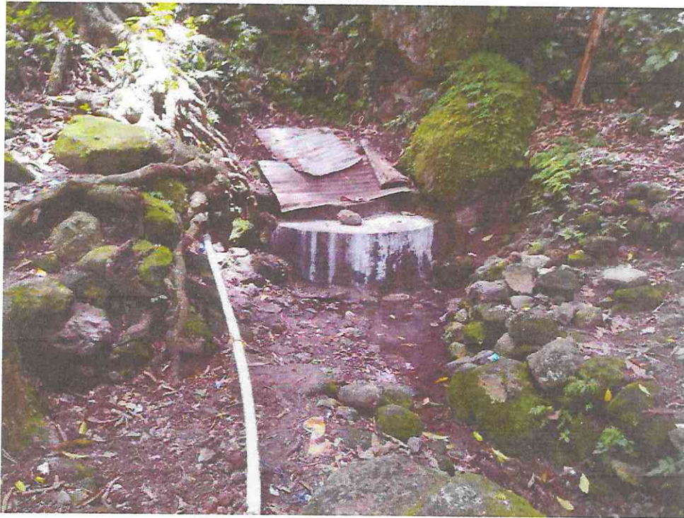
Trabajos preliminares en Obra de Toma