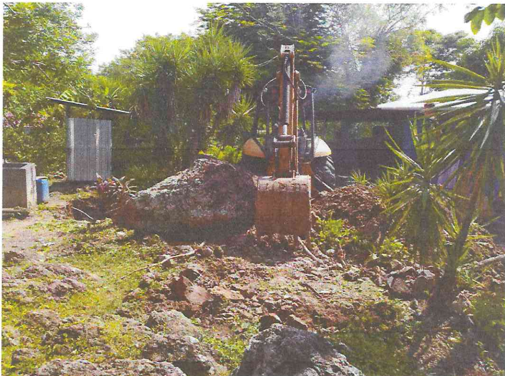
Remoción de rocas del sitio donde se construirá el tanque aéreo