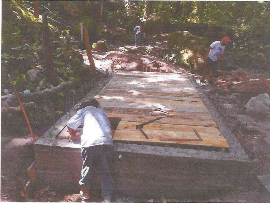
Encofrado, armado de hierro y fundido de losa de Losa Superior de Cisterna