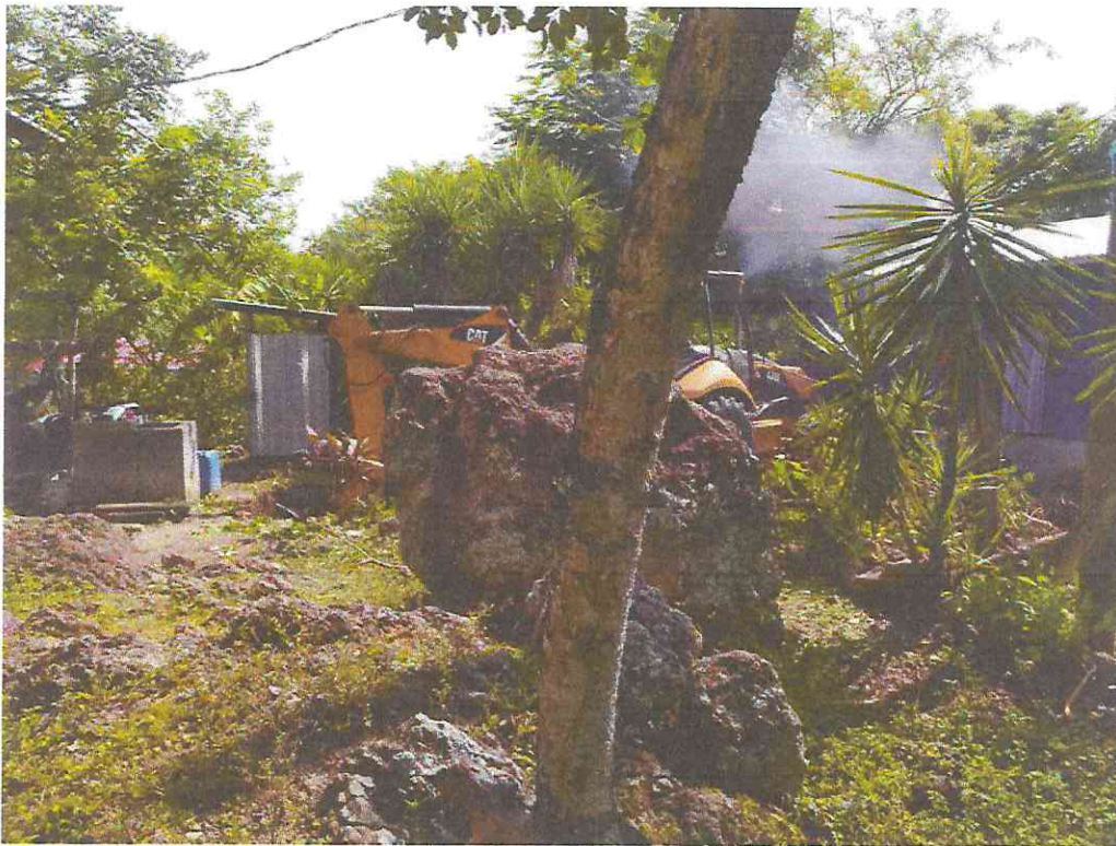
Remoción de rocas del sitio donde se construirá el Tanque Aéreo