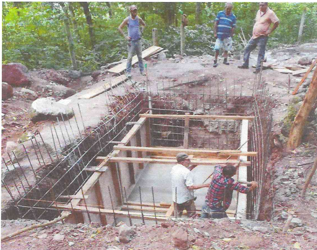
Encofrado y función de paredes de Cisterna