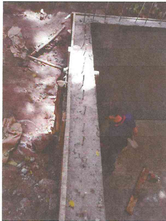
Fundido y Pulido de paredes