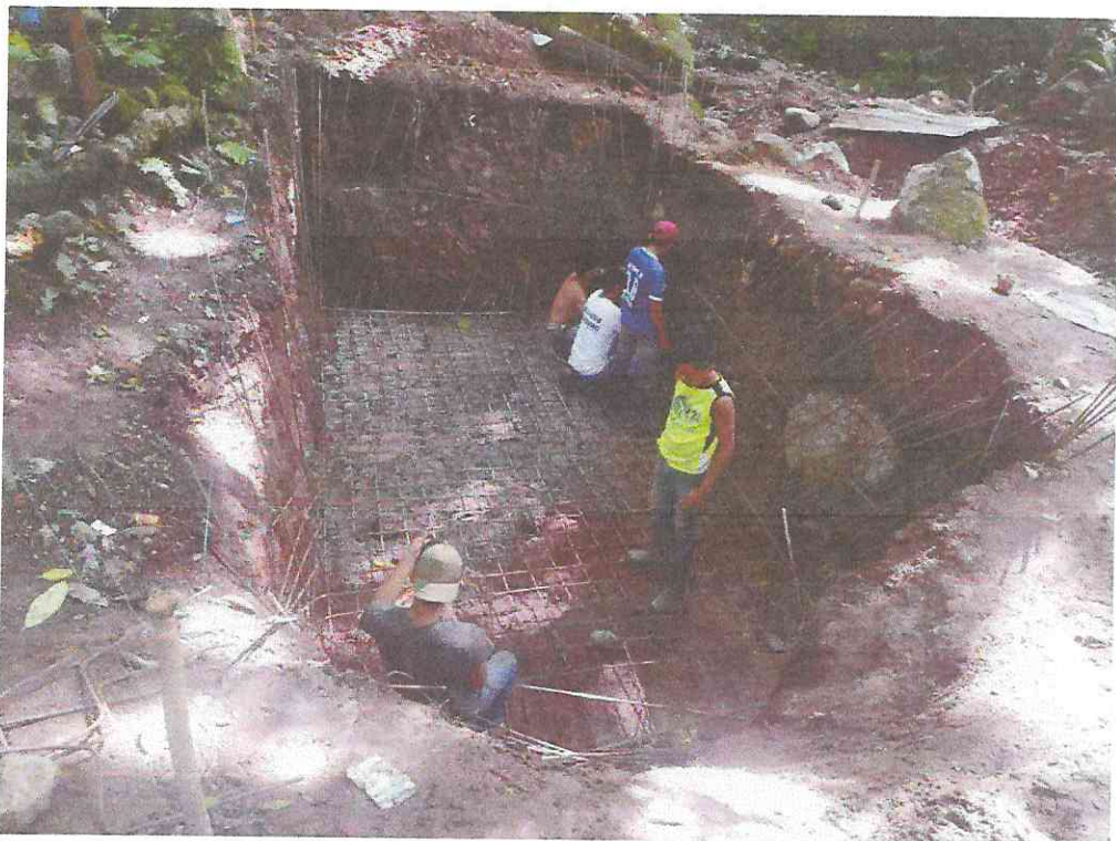
Fundición de Base de Cisterna con concreto Ciclópeo y armado con Acero de 3/8" de losa de piso y de paredes de la cisterna