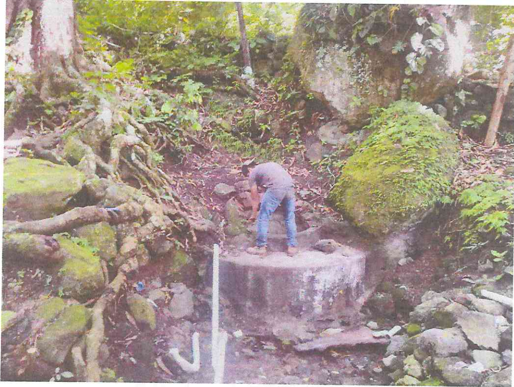
Trabajos de mejoramiento en la obra de Toma