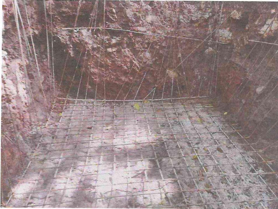
Cisterna: Armado con Acero de 3/8" de losa de piso y de paredes de la cisterna