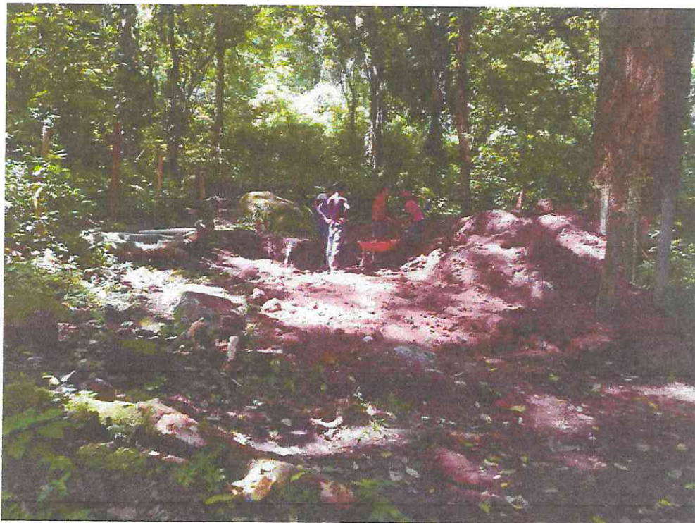
Excavación para Construcción de Cisterna y acarreo de material de excavación