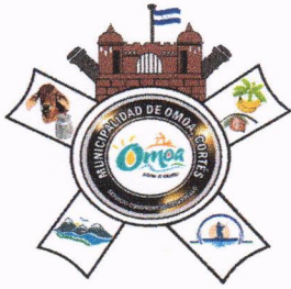
Escudo de Armas