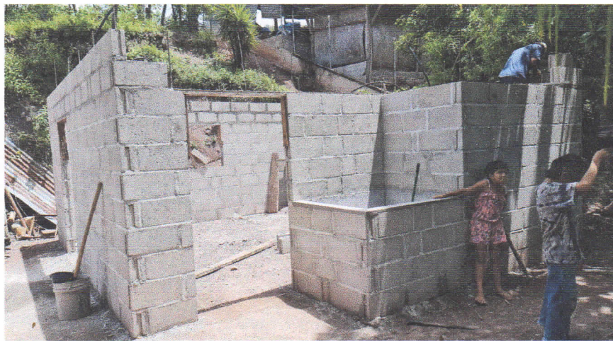
En las imágenes observamos el avance en la construcción de la vivienda

Ceguaca, Santa Bárbara 03 de Septiembre 2021