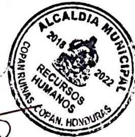
Genesis Mendoza Gerente de Recursos Humanos

Adjunto la planilla de empleados permanentes, correspondiente al mes de Agosto del año 2021 con el objetivo que se proceda a su respectiva publicación en el portal de transparencia.