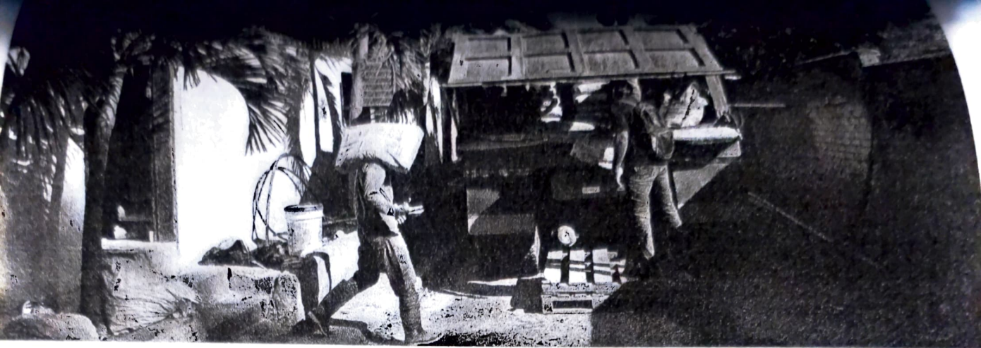
carreo de cemento