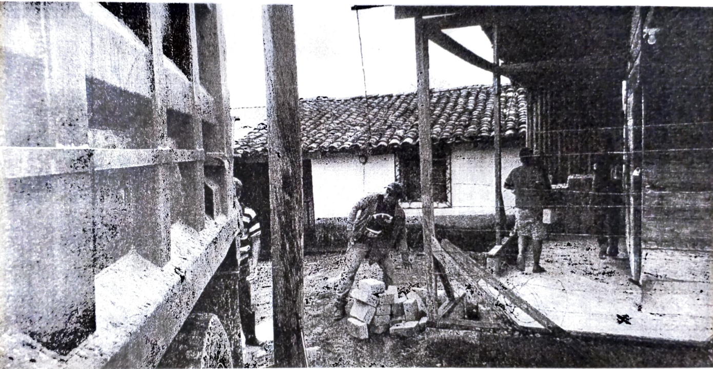
Descarga de ladrillos en la Aldea de Concepción de Soluteca