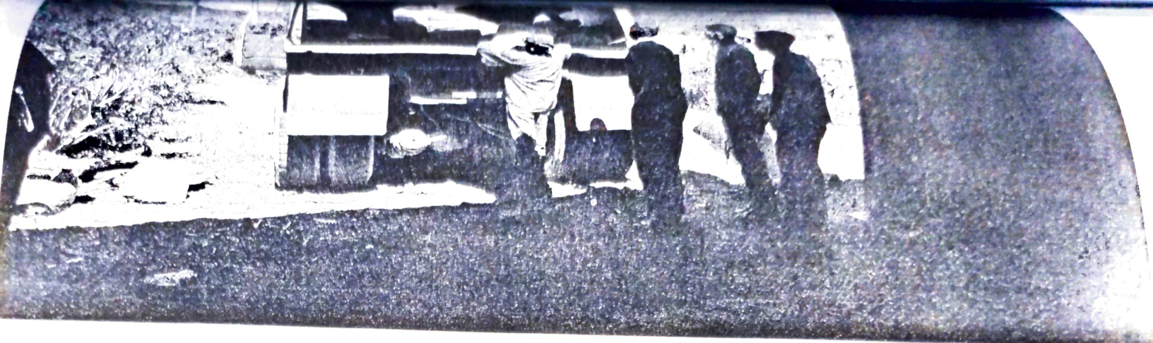
Descarga de cemento en la comunidad de Nueva Generación