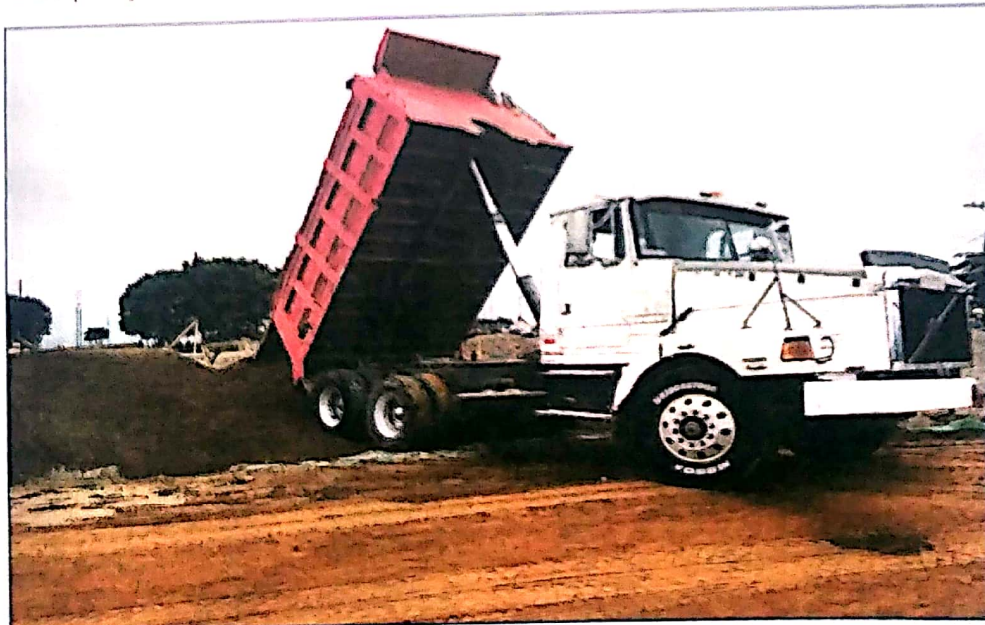
Compra y acarreo de arena de rio lavada

TELÉFONO: OFICINA ALCALDE 2274-3849 SECRETARIA: 2774-3843 / 2774-2566 ADMINISTRACIÓN: 2774-3922 / 2774-0985 TELE-FAX 2774- 0987 ANEXO MUNICIPAL 2774-0986 EMAIL: ALCALDIA@LA PAZ.HONDURAS.GOV.HK