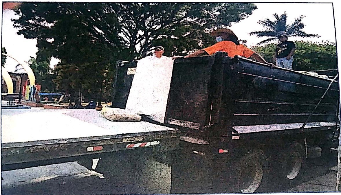
Trasbordo de cemento, de la rastra a la volqueta para trasladarlo al proyecto