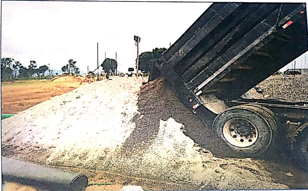
Compra y acarreo de arena