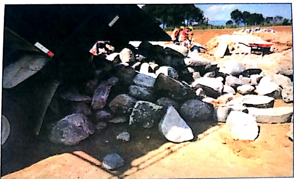
Acarreo de piedra