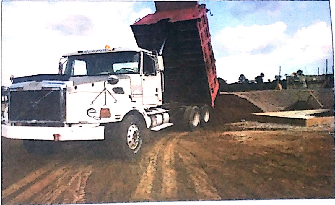
Compra y acarreo de arena de rio lavada