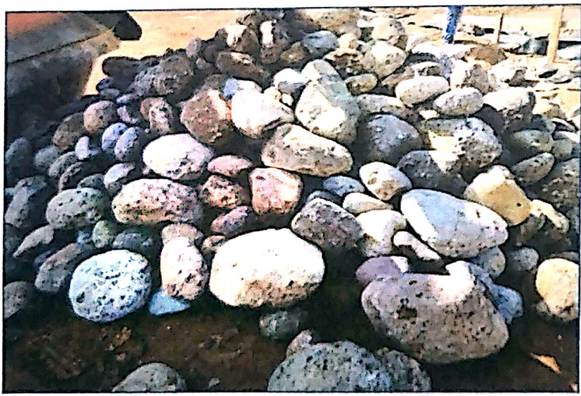
Compra y acarreo de piedra puesta en el proyecto

TELÉFONO: OFICINA ALCALDE 2274-3849 SECRETARIA: 2774-3843 / 2774-2566 ADMINISTRACIÓN: 2774-3922 / 2774-0985 TELE-FAX 2774-0987 ANEXO MUNICIPAL 2774-0986 EMAIL: ALCALDIALAPAZ@YAHOO.ES