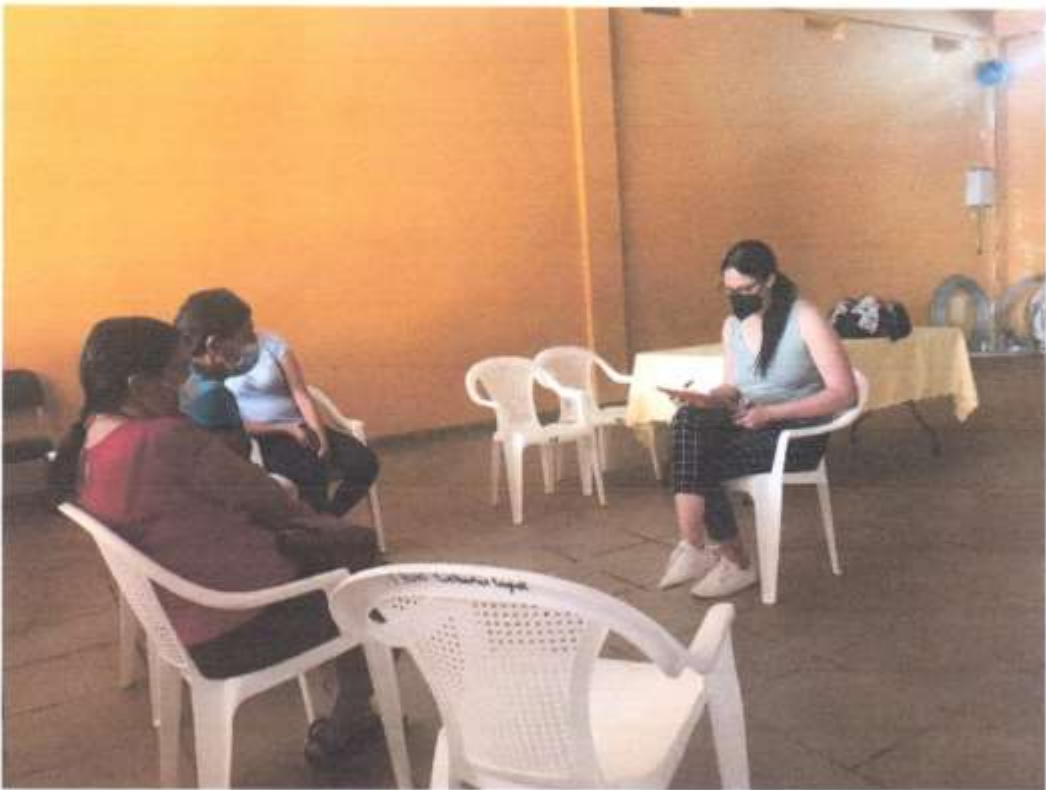
Reunión con las mujeres y técnica de ASONOG para dar a conocer un proyecto de Derechos humanos.