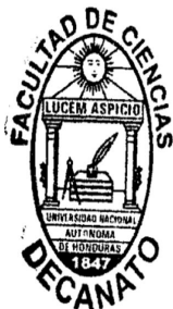
NABIL KAWAS Decano a.i.